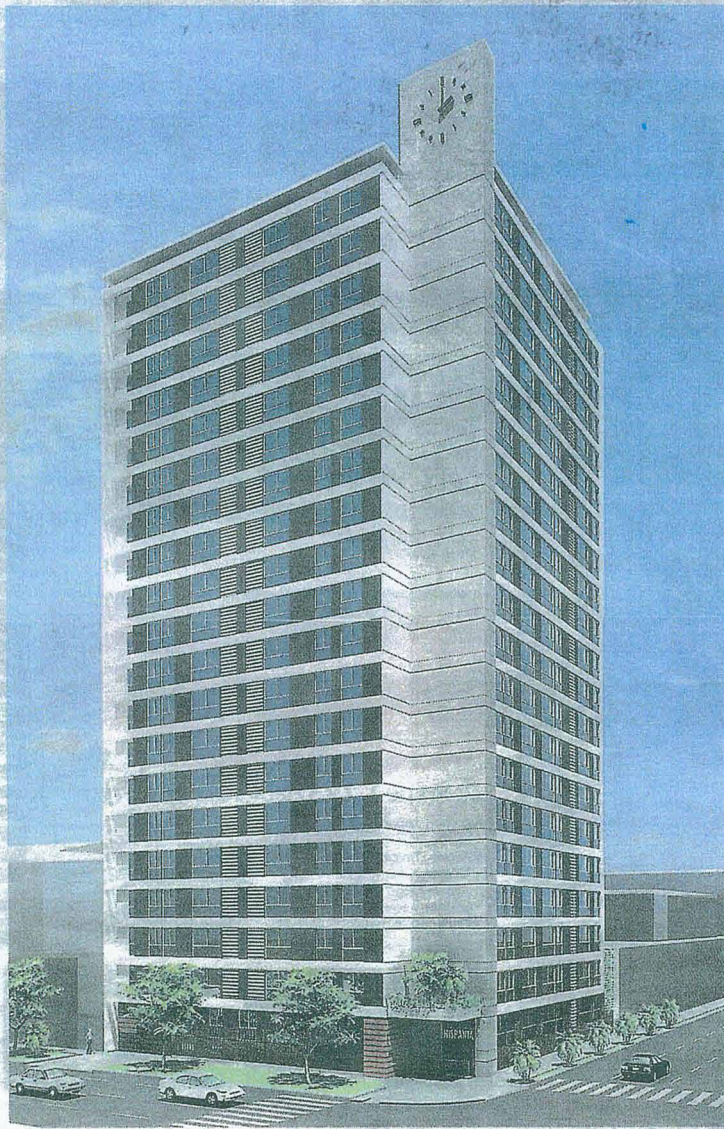
FACHADA. Con estilo moderno compatible con el entorno. El edificio tendrá 4 niveles de sótanos.

“Los departamentos están bien distribuidos y tienen una óptima ventilación e iluminación para que los futuros propietarios se sientan cómodos y a gusto”, re-