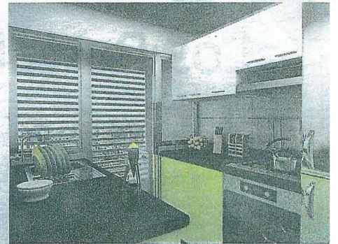
COCINA. Equipada con muebles altos y bajos, campana y horno