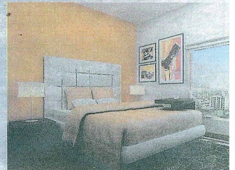
DORMITORIO PRINCIPAL. Cuenta con clóset y piso laminado.